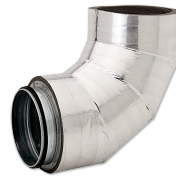
LWF DRB 160-90